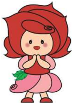
茨城県教育委員会マスコットキャラクター 「ふれあちゃん」