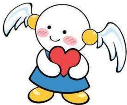
茨城県人権啓発キャラクター 「ココロちゃん」