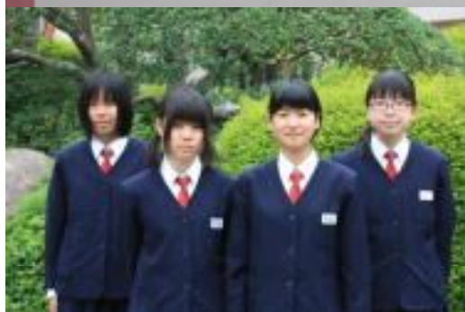
義援金募金活動の中心となった 友愛委員会委員長のOさん達

友愛委員会では、委員会の時間に「東日本大震災で被災された方々に対して、今自分たちに何ができるのか」について話し合いをしました。その結果、各学級ごとに友愛委員が中心となって、生徒からの善意を募ろうということになりました。